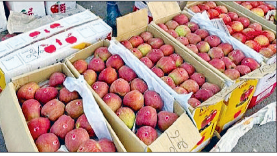
रेवाड़ी। नाईवाली सब्जीमंडी में दुकान पर रखे सेब।

हरिभूमि न्यूज ▶▶ रेवाड़ी मानसून के सीजन में इस बार भारी बारिश के कारण खराब हुई सब्जियों की फसल का असर अब देखने को मिलना शुरू हो गया है। टमाटर को छोड़कर अन्य लगभग सभी सब्जियों के दाम बढ़ रहे हैं। टमाटर की कीमतों में कमी जरूर आई है। हिमाचल में फसल बर्बाद होने के कारण सेब के दाम भी बढ़ने शुरू हुए हैं, जो नवरात्रों में आम लोगों की पहुंच से बाहर हो सकते हैं। जिले में सब्जी की फसलों का रकबा लगभग 2 हजार हेक्टेयर तक सीमित