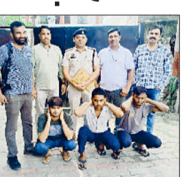
रेवाड़ी। पुलिस गिरफ्त में आरोपी।