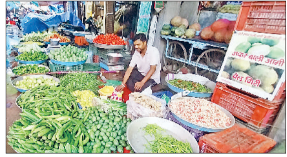
रेवाड़ी। नाईवाली सब्जीमंडी में दुकान पर रखी सब्जियां।

जम्मू कश्मीर से भारी मात्रा में सेब की आपूर्ति होती है। दोनों राज्यों में बाढ़ के बाद सेब की आपूर्ति पर ब्रेक लग चुका है। रास्ते बंद होने के कारण सेब की आपूर्ति नहीं हो पा रही है, जिससे इसके दामों में उछाल आना शुरू हो गया है। साधारण किस्म की सेब अब 150 से 200 रुपये प्रति किलोग्राम हो गई है। अच्छी क्वालिटी की सेब के दाम 250 रुपये प्रति ब्रेक लग चुके हैं। इस समय श्राद्ध पक्ष चल रहा है, जिससे सेब की डिमांड कम है। नवरात्रों में सेब की डिमांड काफी बढ़ जाती है। माह के अंत