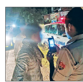
वाहन चालकों की जांच करती पुलिस।

शराब पीकर वाहन चलाने वालों के खिलाफ पुलिस सख्त